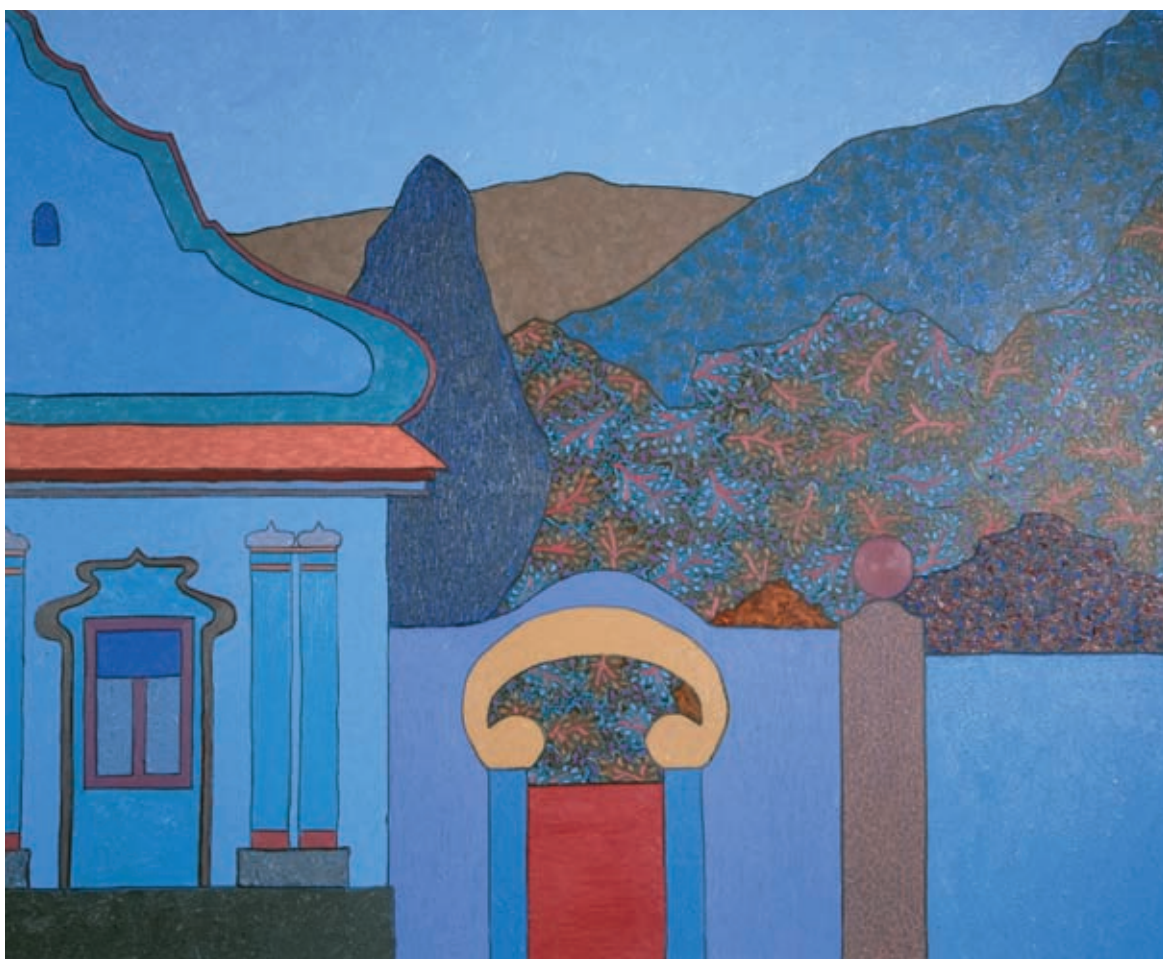
Barokk kúria, különálló lakrésze eladó, 2006