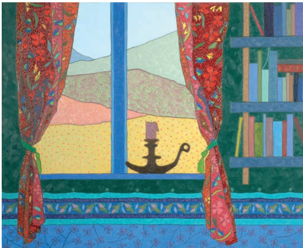
Ne itt kiabálj, szerenádolni az ablak alatt kell!, 2006